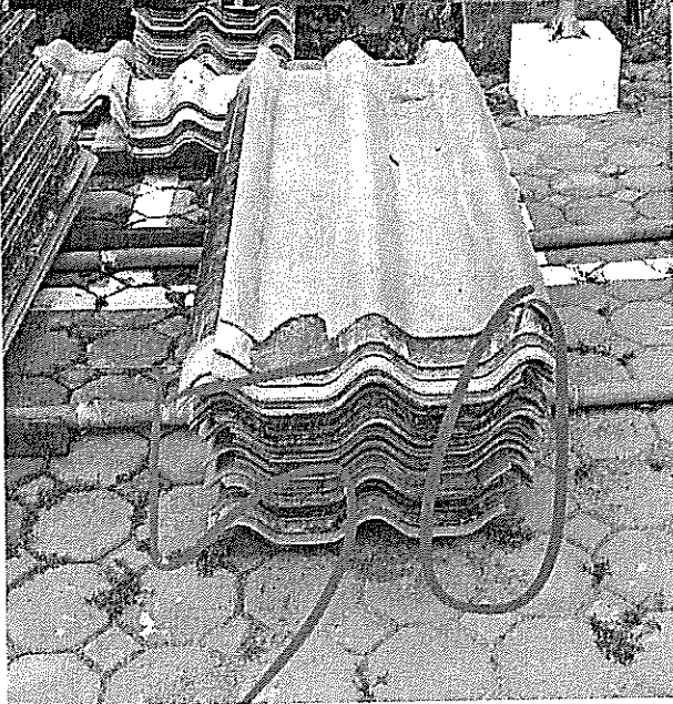
กระเบื้องลอนคู่เก่า แฉวละ 50 แผ่น มี 1 แฉว รวม 50 แผ่น

รวมกระเบื้องลอนคู่เก่าทั้งสิ้น 2,250 แผ่น