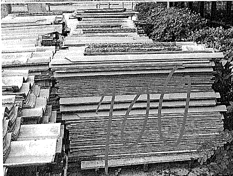
กระเบื้องลอนคู่เก่า แฉวละ 100 แผ่น มี 10 แฉว รวม 1,000 แผ่น